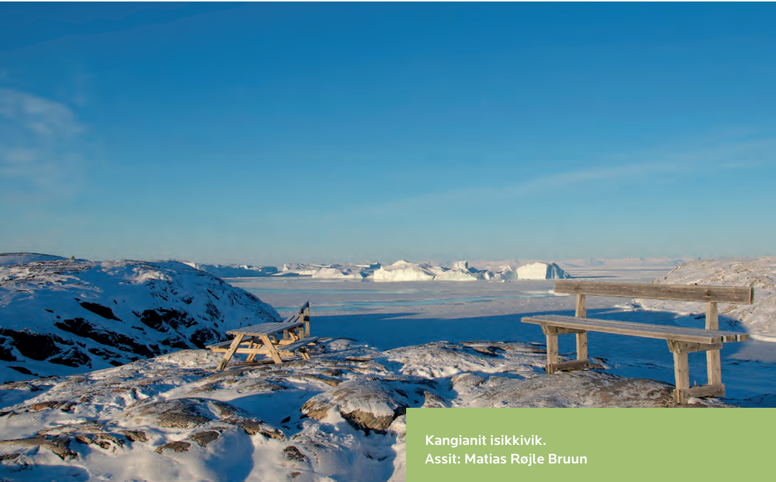
Kangianit isikkivik. Assit: Matias Røjle Bruun